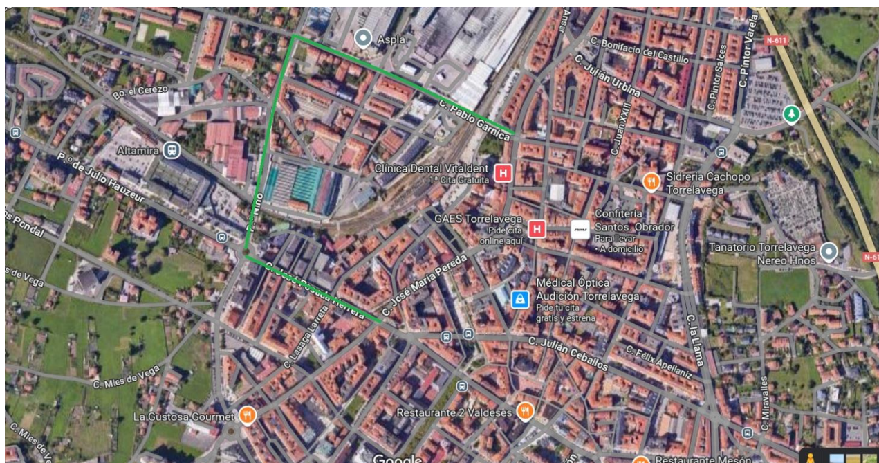
Ilustración 2 DESVIO L2 TORREBUS